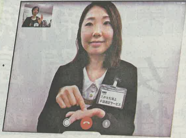
三井住友海上火災保険のテレビ電話による手話通訳サービスのイメージ

損害保険各社 損保ジャパン日本興亜は2017年9月、自動車保険の受け付けや初動対応に当たるコールセンターで手話サービスを始めた。事故の際、代車手配や病院や相手側への連絡を同社が24時間する。